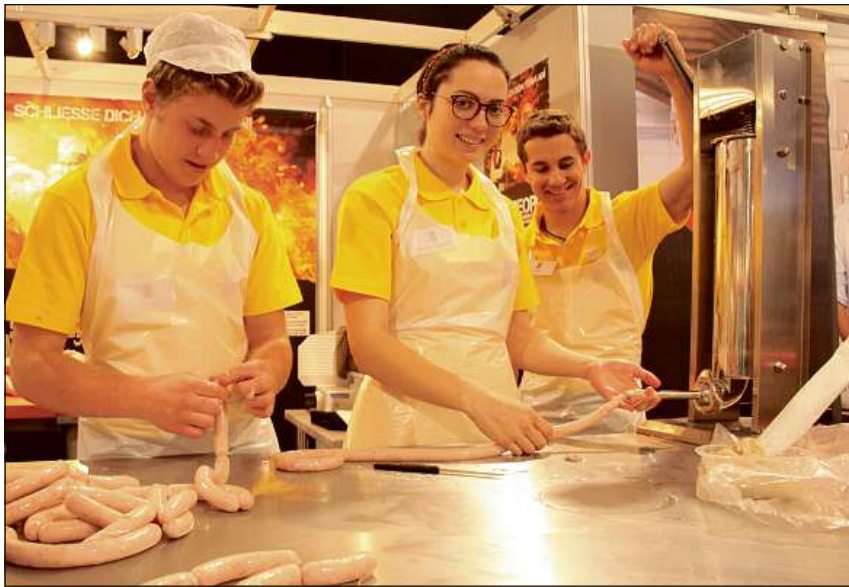
Emprendists da mazlers mancan intgins en noss chantun.