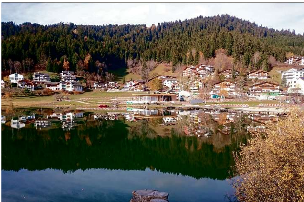
Egl ambient dil Lag Grand dat la nova ustria Lags gnanc en egl.