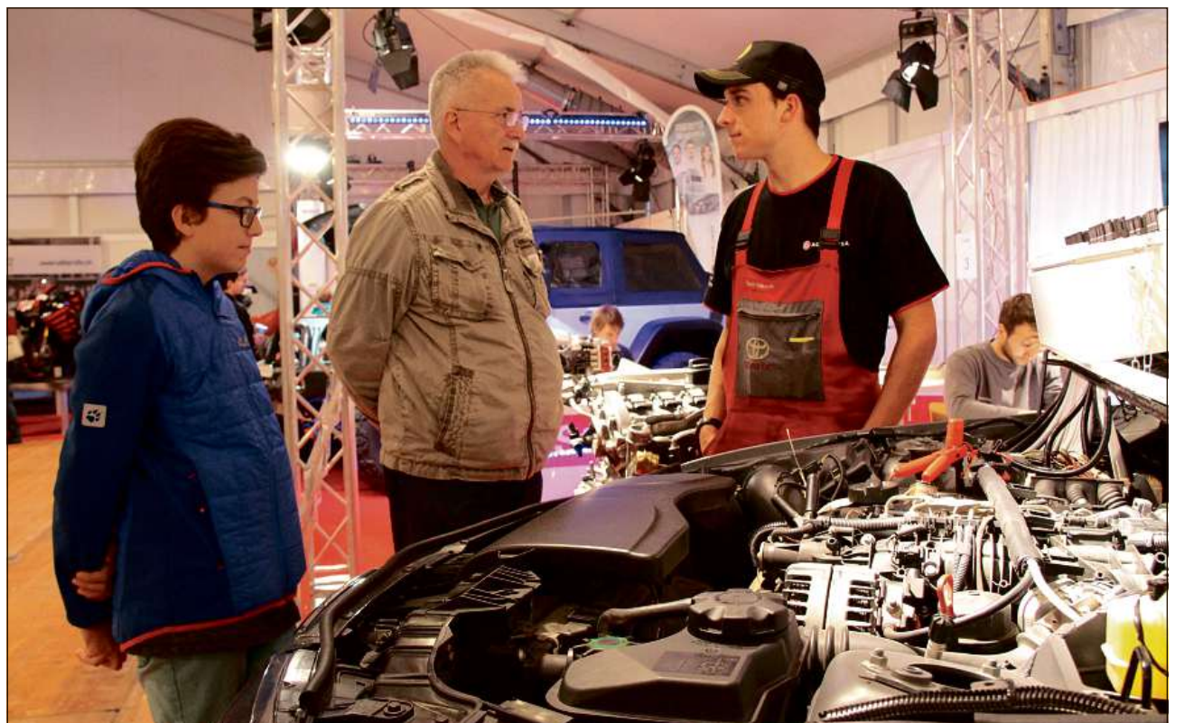
Autos dastgan segir na mancar tar in'exposiziun da professiuns.

Cioccarelli ha ditg che l'exposiziun saja dapi l'emprima ediziun adina vegnida pli gronda e quai saja er quest onn tar la tschintgavla ediziun il cas. Prioritad haja dentant la qualitat, ella che saja il criteri principal per ils organisaturs. La finamira saja d'optimar d'exposiziun tar exposiziun la purschida e lura er da guardar d'esser qualitativ à jour, punctuescha Cioccarelli. La fin d'emna stattan guidas sin il program e quai gist en set linguas. La dumengia bainbaud vegnan undrads ils mats e las mattas da noss chantun ch'han fatg tar ils Swiss Skills a Berna medaglias. Da la partida èn lura er persunas da la politica communal, chantunala e naziunala. In di avant ha lura lieu la revista da moda cun vistgadira da tut las professiuns. L'entschatta da l'exposiziun Fiutscher è stada fitg buna cun visitar ier ina rotscha classes l'occurranza e chaschunar per bler moviment en la halla da la citad ed er enturn quella.