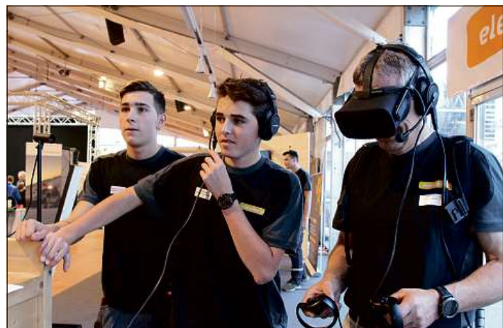
La digitalisaziun è in grond tema tar l'exposiziun professiunala Fiutscher ch'ha lieu dapreschent a Cuirra.