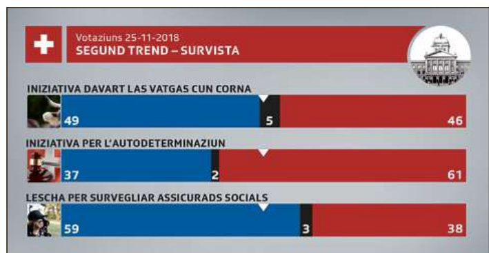
Uschia avess il suveran svizzer votà l'entschatta november.