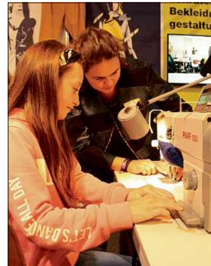
Questa matta vul eventualmain daventar ina giada cusunza.

Fin dumengia, ils 18 da november 2018 vegnan preschentadas passa 300 professiuns e purschidas da furmaziun supplementara a numerus stans en la halla da la citad. Ils visitaders han la chaschun da guardar als emprendists sur la givella e da far in discurs cun quels. I vegn er lavurà al lieu, ils scolaras e las scolaras dastgan collavurar e sa participar a pliras concurrenzas. Ils giuvenils han er la pussaivladad da sentir ils materials e da tutgar els. Ils bunamain 80 expositurs mussan en