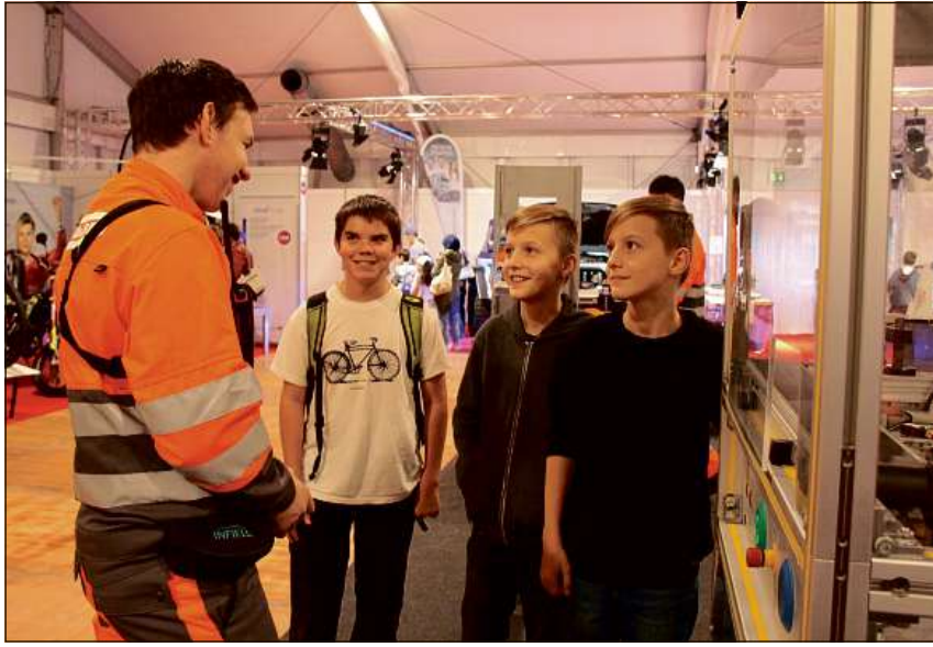
Preschenta a l'exposiziun è er La Viafier retica.