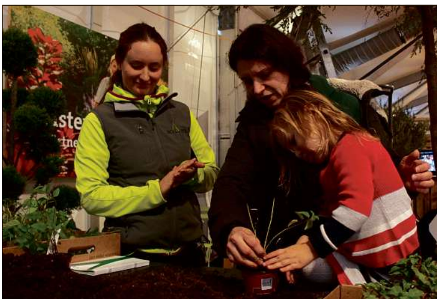
Ortulan ed ortulanas han er in stan en la halla da la citad a Cuira.