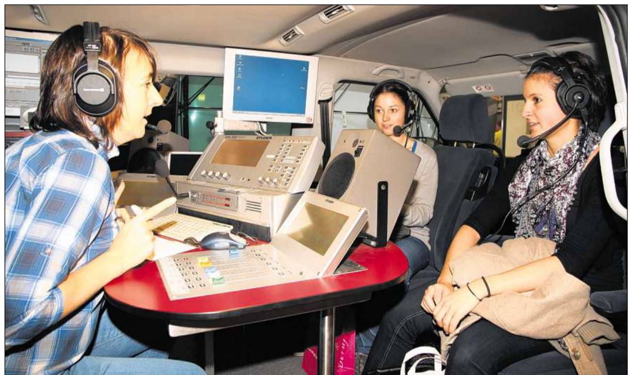
Quels ch'han dapli interess da far radio pon far quai en il bus da rtr che sa chatta al stan. MAD

■ (rtr) Dals 5 fin ils 9 da november 2014 ha lieu a Cuira il «Fiutscher», l'exposiziun professiunala grischuna per scolaziuns e furnaziun. RTR Radiotelevision Svizra Rumantscha è era preschent cun in stan. La datti la pussaivladad da far radio en il bus d'emetter da rtr u da sa sentir sco in moderatur da la television e far ina moderaziun. Cun in stan attractiv sa