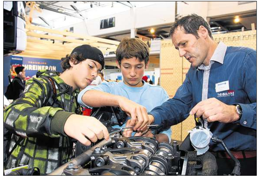
Tar la firma Thomann SA èn cunzunt ils mats sa divertids e gist lavurà en il lieu.

Ils tschintg dis da l'exposiziun è stà bler travagl en la halla da la citad a Cuira. Simpatic è cunzunt er stà che dasper ils patruns da lavur han er emprendistas ed emprendists dà pled e fatg als 3500 giuvenils ed a tuts ils auters interessads. Scolaras e scolars han er gi occasiun da lavurar gist en il lieu e far experientscha cun las diversas materias. Professius manualas sco scrinari ubain miradur han en spezial interessà ils mats da diesch fin 15 onns e quai è er stà il cas tar las clamadas che han en ina moda ubain l'autra da far insatge cun tecnica. Vegnir pur, quai para er dad esser ina professiun da siemi da blers mats e schizunt mattas. Almain tar il stan dal «Planthof» era quel di che nus essan stads a l'exposiziun bler moviment. Da far in emprendissadi mercantil è anc adina in da quels giavischs da numerusas mattas ed er per quellas era la letga fitg gronda tar l'exposiziun «Fiutscher». Professius sin il sectur da sanadad paran dentant er da svegliar bler interess tar las mattas ed er qua vess la paletta betg savi esser pli gronda. Tut en tut ina exposiziun multifara ch'è in bun mussavia per mintga matta e mat per far in fundament decisiv per la vita professiunala.