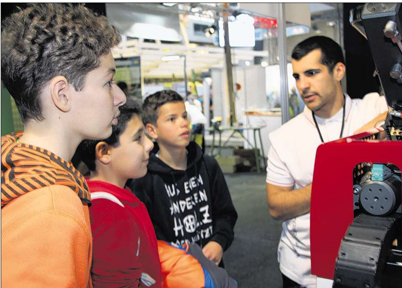
Professius che han da far cun tecnica èn chaussas dals mats.