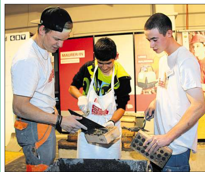
Dus miradurs futurs cun in giuvenil che ha gist lavurà en il lieu.