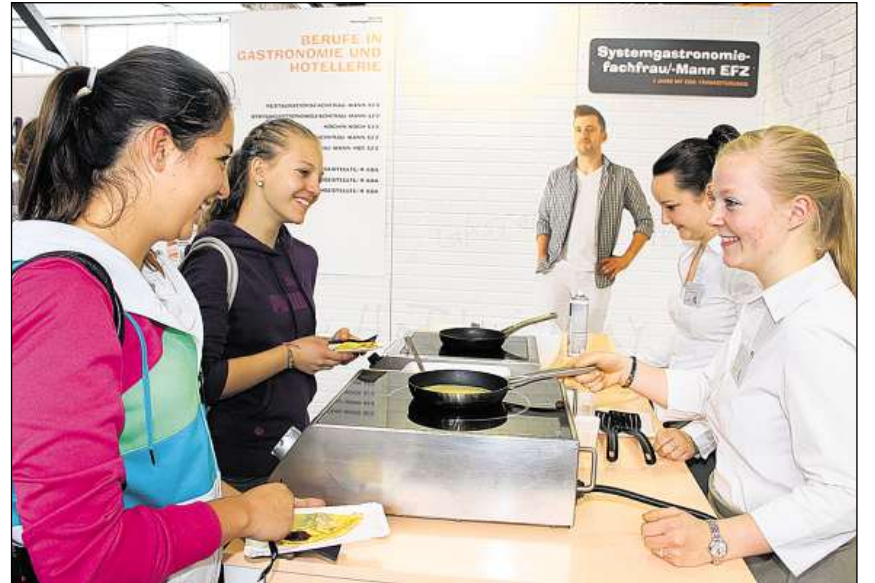
Cuschinier, quai è betg mo ina professiun per mats.