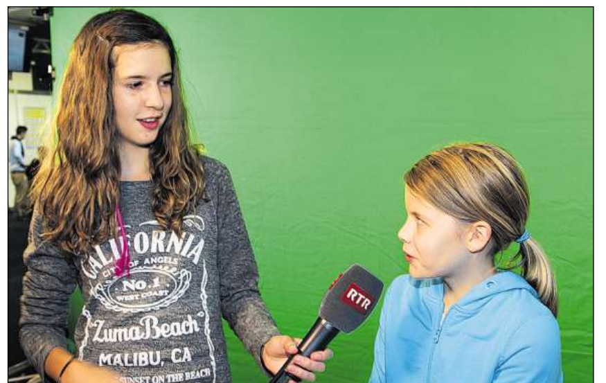
Tar il stan da Radiotevisiun Svizra Rumantscha han tuts gi occasiun da far intervistas.