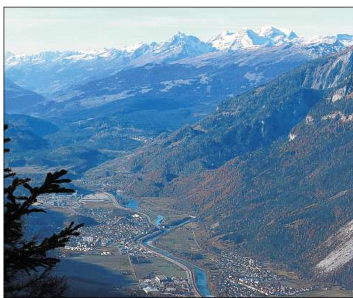
Il Plau cun Domat (seniester) s'auda tier l'aglomeraziun da Cuera.