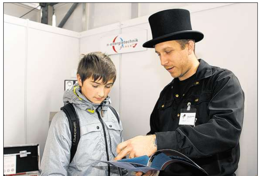
In spazzachamin declera ad in mat sia lavur da mintga di.